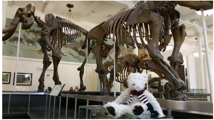
In het American Museum of Natural History