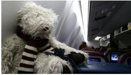
Flip in het vliegtuig